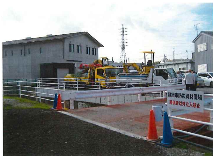
作業前現地確認状況